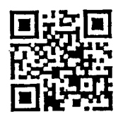
QR Code ส่งเอกสารการโอนเงิน กฐินพระราชทาน มท. ปี ๒๕๖๔

ที่อยู่ กองคลัง สำนักงานปลัดกระทรวงมหาดไทย กระทรวงมหาดไทย ถนนรัชฎางค์ กรุงเทพฯ ๑๐๒๐๐